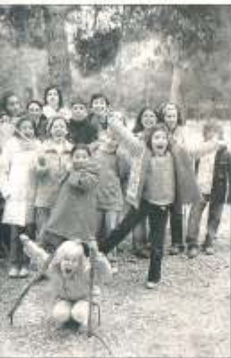
Los niños actuarán el 30 de octubre en el Conservatorio.

Asociación Cultural Música y Expresión busca