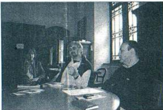
Un momento della presentazione.