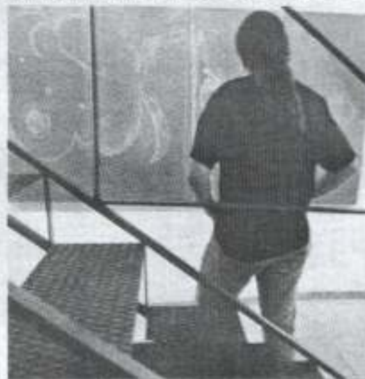
ESENCIA. La fuerza plástica, característica común en los tres pintores.

sión de un momento formal acertadamente planteado.