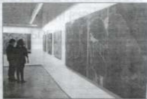
Forma y sustancia, en la galería Raporstak.