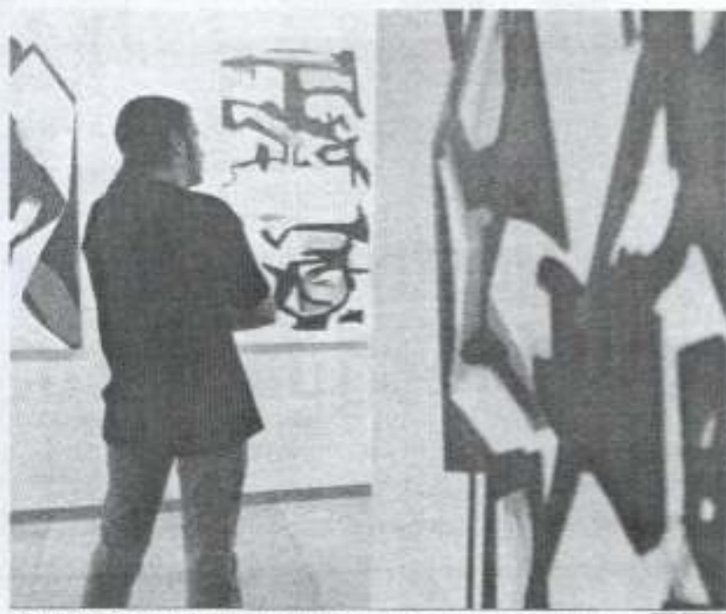
ABSTRACTO. Un visitante observa una de las obras expuestas en la Galería Representación.