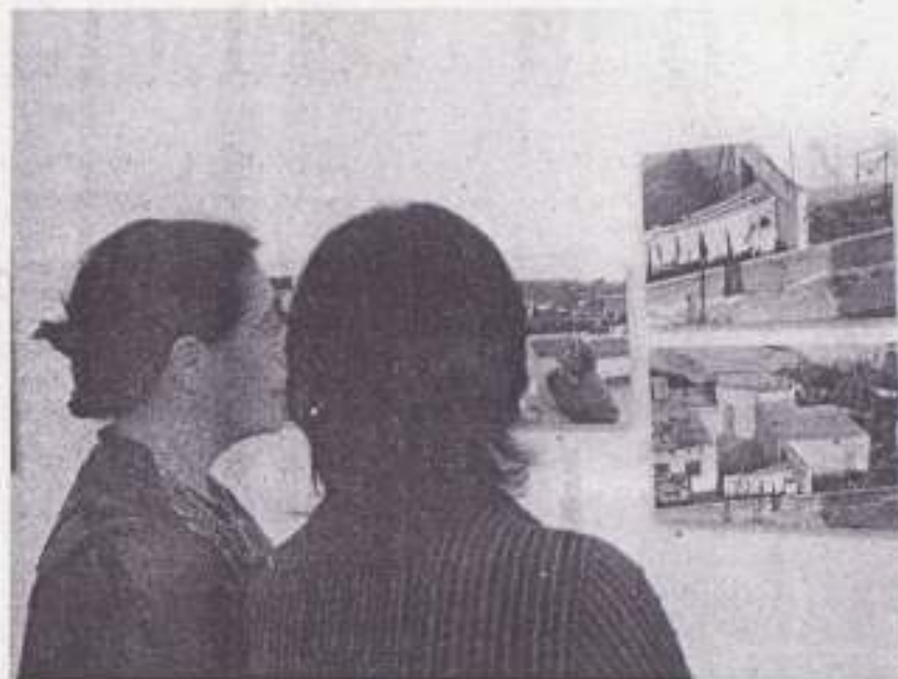
Das personas observan cuadros de esta exposición colectiva.

La vida cotidiana, el papel de la mujer en la sociedad egipcia, la evolución social que desde 1953 se desarrolla en el país, los contrastes entre la tecnología y los arraigados atavismos culturales, el choque y la conviven-