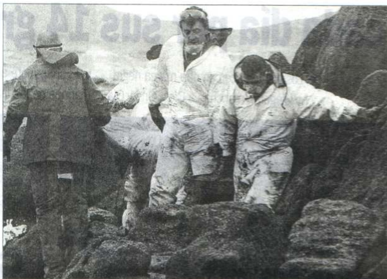
Los trabajos de limpieza de playas se prolongaron durante el día de ayer en O Grove.

Y es que la comisión de O Grove quiere evitar dañar a las piedras, donde se asientan algas o cría de mejillón. Así, están re-