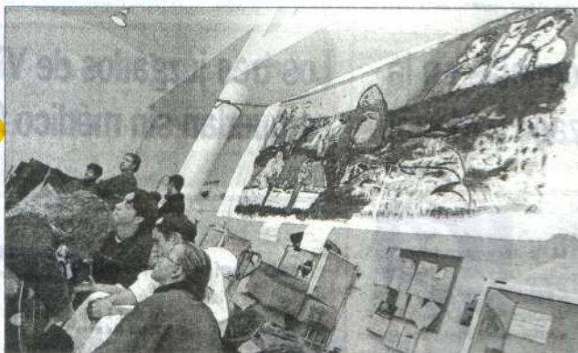
El cuadro de la imagen ondea en el centro de la lonja de O Grove.

Dos pintores de Granada quieren evitar que esta tragedia caiga en el olvido